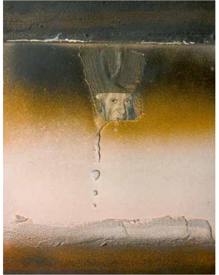
El pontífice del arte, 1985 Técnica mixta/cartulina, 32,5x25 cm Col. Peiró-Marzal