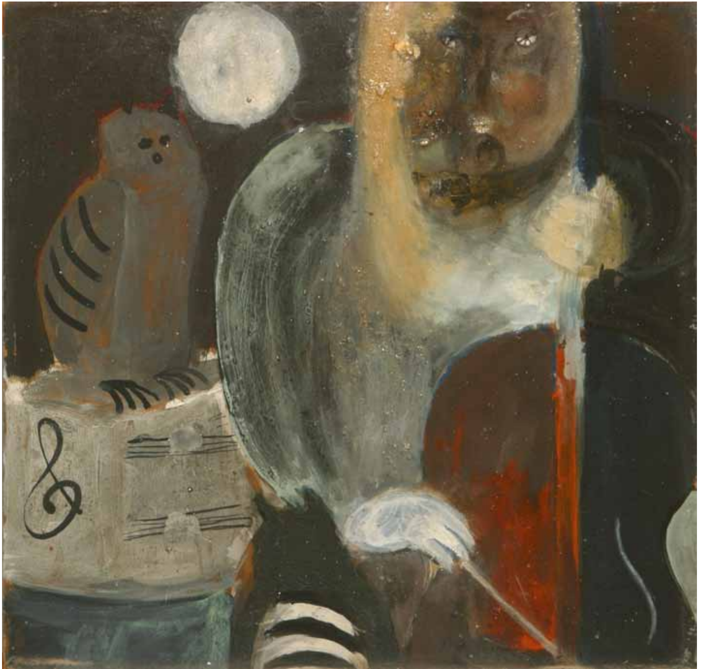
El concierto de la musa, 1964 Técnica mixta/tablero, 69,5x66,5 cm Col. Peiró-Marzal