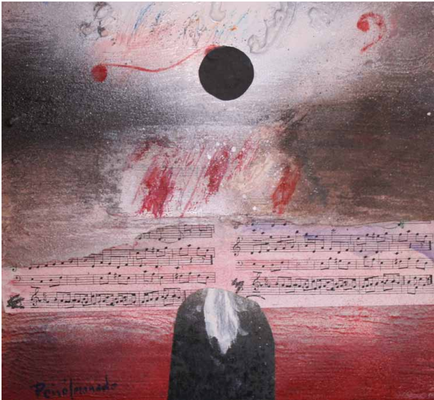
Magia en clave de sol, 2008 Técnica mixta/tablero, 26x28 cm Col. Peiró-Marzal