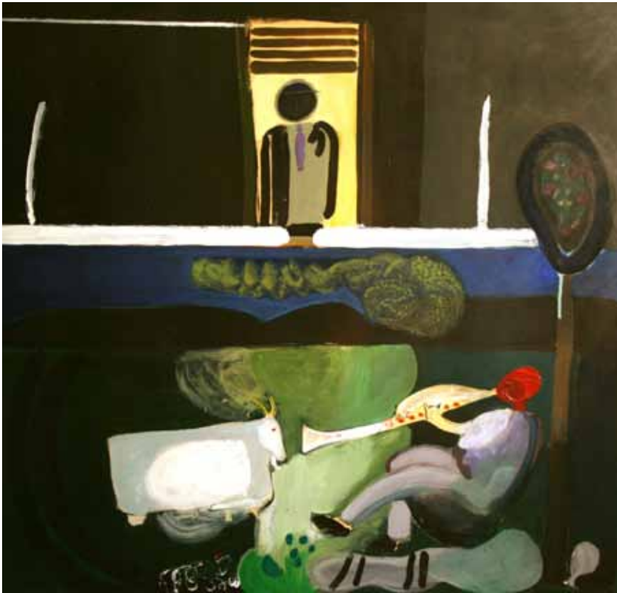
Paisaje humano, 1969