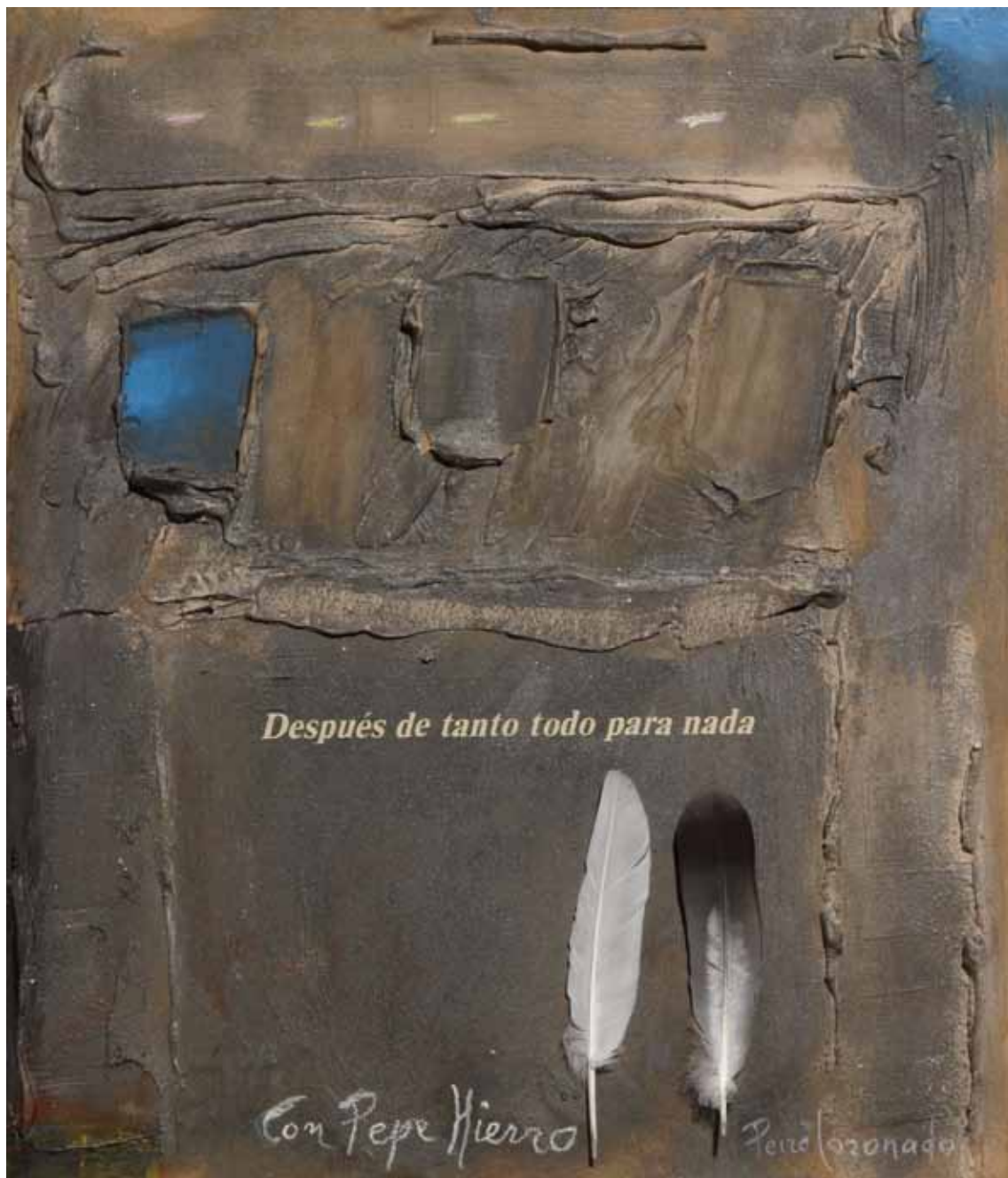
Con Pepe Hierro, 2004 Técnica mixta/tablero, 46x38 cm Col. Ajuntament de Benicarló