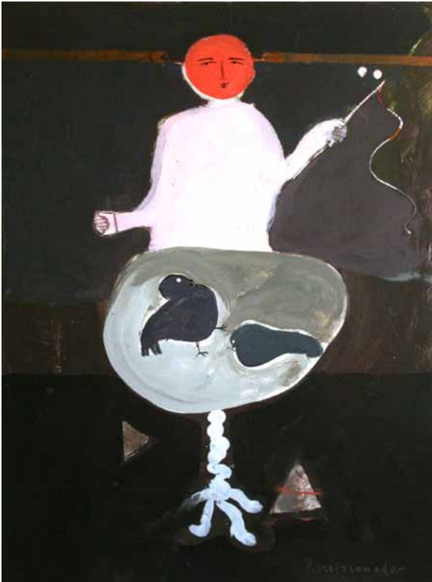
Domador de palomos, 1969 Técnica mixta/cartulina, 74x52 cm Col. Peiró-Marzal