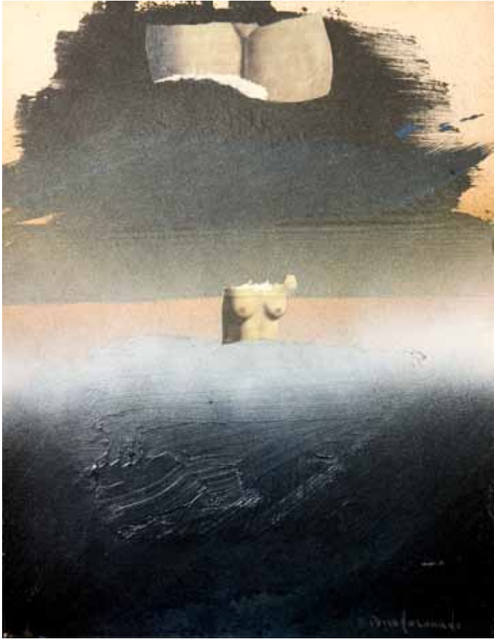
Jugando con magritte, 1973 Técnica mixta/cartulina, 32x24,5 cm Col. Peiró-Marzal