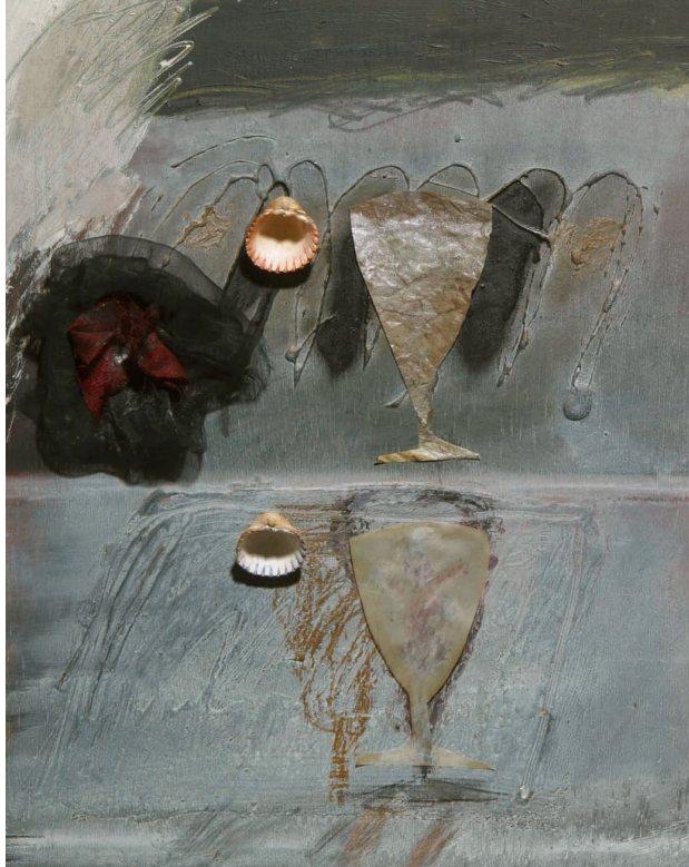
| Recuerdos dolorosos de la mujer