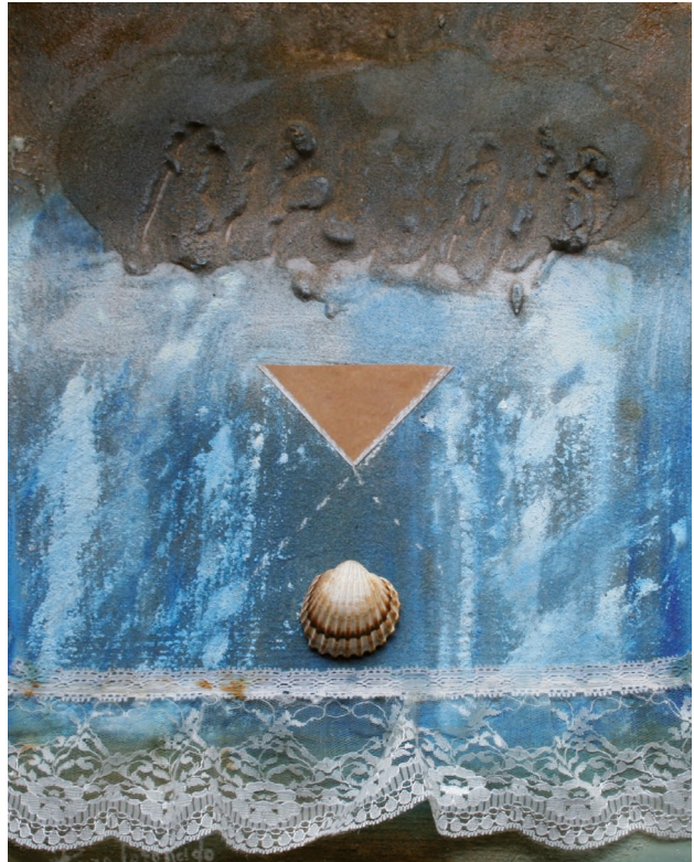
| Mujer cuánto silencio |