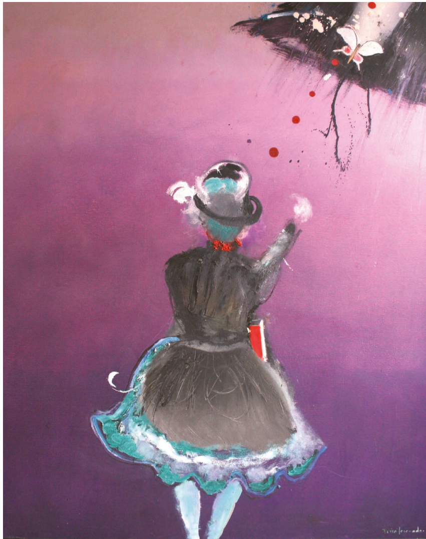
|Cazadora de sueños