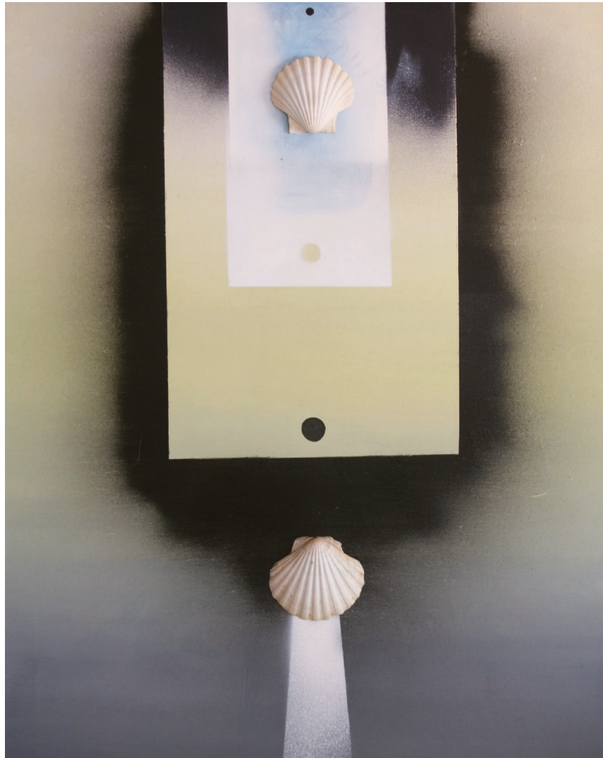
|Espacio femenino abierto al infinito