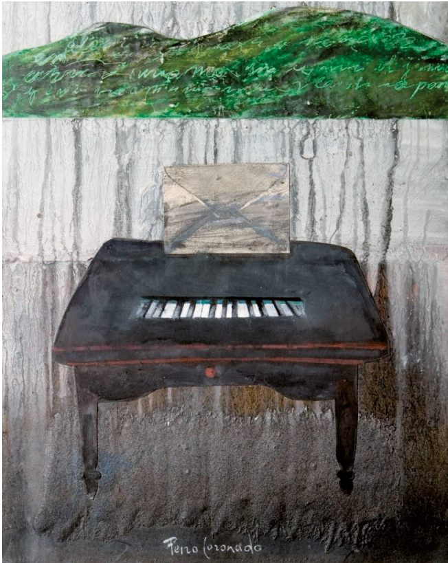
| Carta a mi madre con misa de requiem