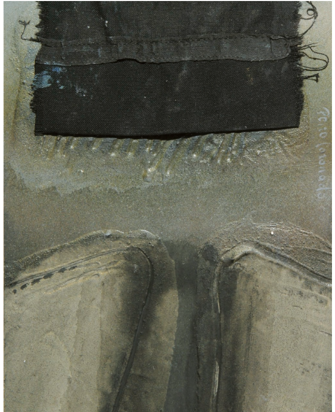
Despedida a mi madre |