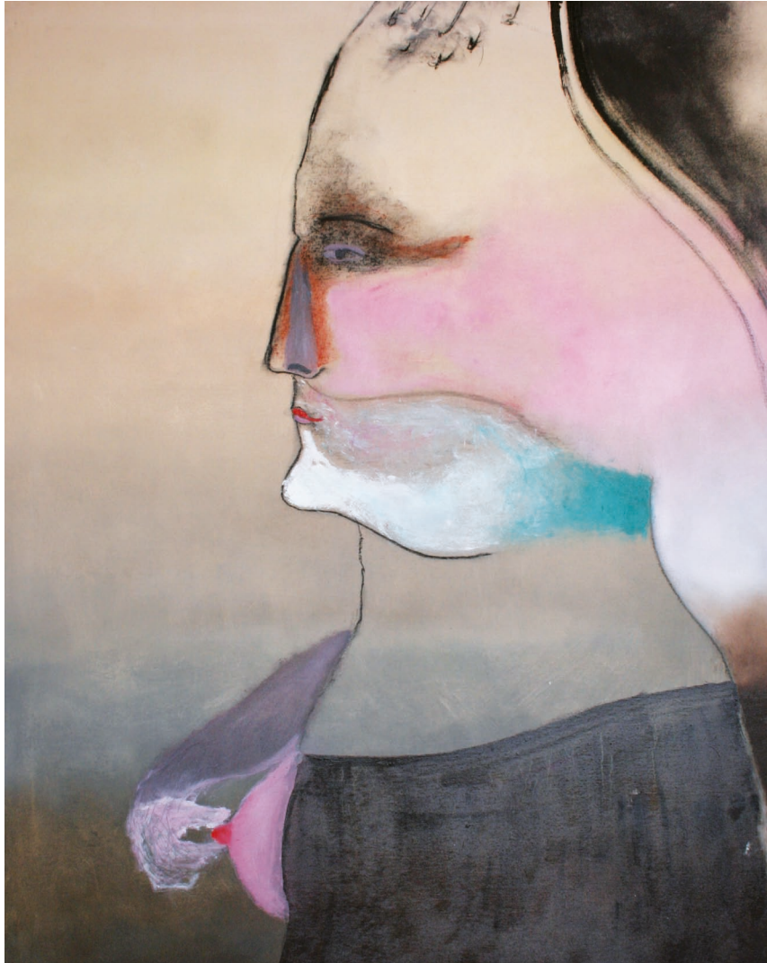
| La visita de la ironía