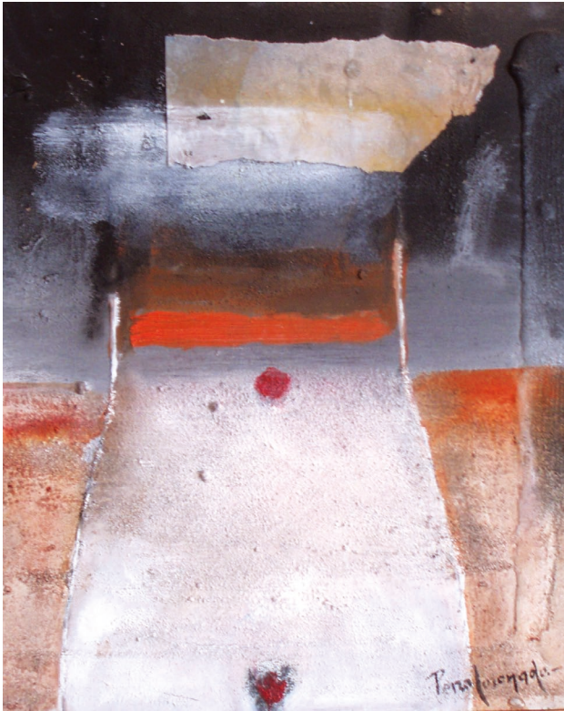
| Descubriendo el espacio