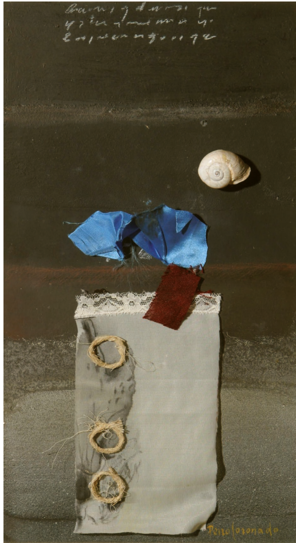
| Escrito de mujer madura a sí misma |