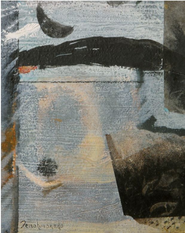
|Navegar cada día