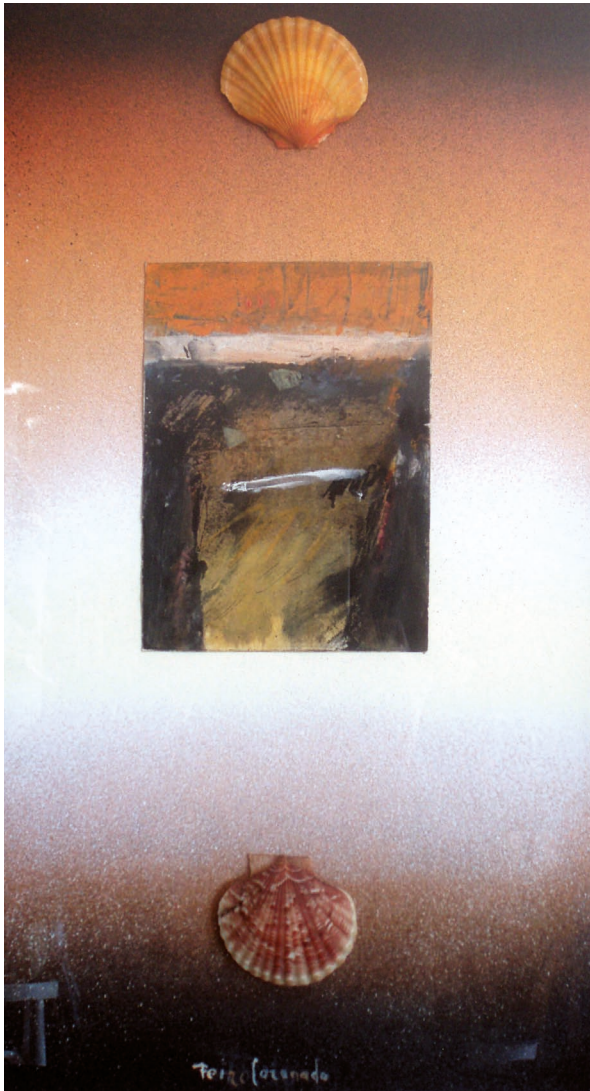
| Tarde de otoño con dudas